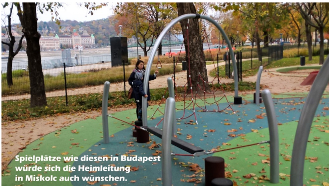
Spielplätze wie diesen in Budapest würde sich die Heimleitung in Miskolc auch wünschen.

Die Kinder fahren mit dem von der Gemeinde (eigentlich von einem freundlichen Ehepaar aus Frankreich) gespendeten stabilen Metallroller über den Hof. Alles muss „unkaputtbar“ sein. Einige Mädchen knüpfen Freundschaftsbändchen, einige ältere wollen reden, aber viele von unserer Gemeinde sprechen kein Ungarisch.