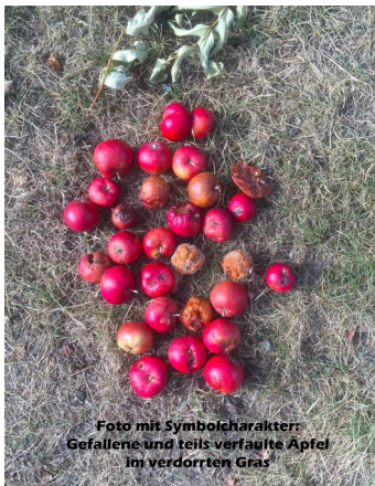
Foto mit Symbolcharakter: Gefallene und teils verfaulete Äpfel im verdorrten Gras